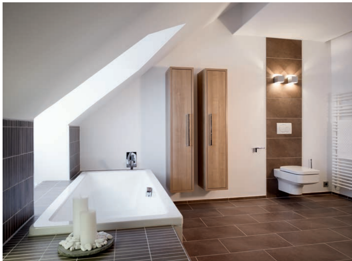
Einblicke in ein barrierefreies Bad, das durch sein Design nicht nur die Generation „50 +“, sondern alle Altersgruppen anspricht.